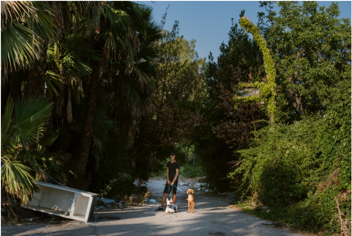
PHOTO 3: Portrait of boy in the garden where there is waste in the open