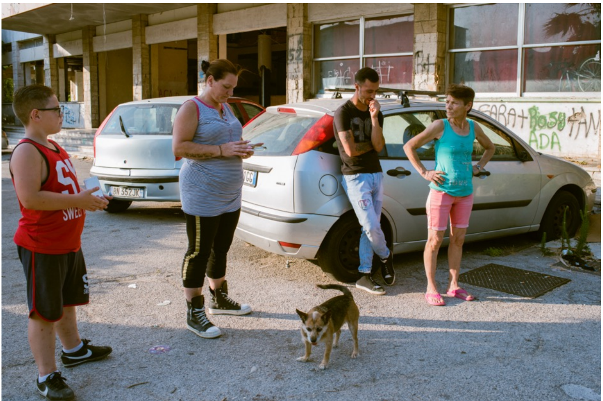
PHOTO 2: Ground floor of the motel, where some of the tenants work the wood