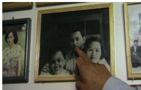
Fiona Tan, May you Live in Interesting Times , documentary film, 1997