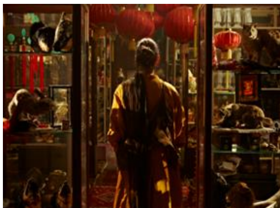
Fiona Tan, Disorient , HD video Installation, 2009 Courtesy the artist, Frith Street Gallery, London and Wako Works of Art, Tokyo. Photographer: Per Kristiansen