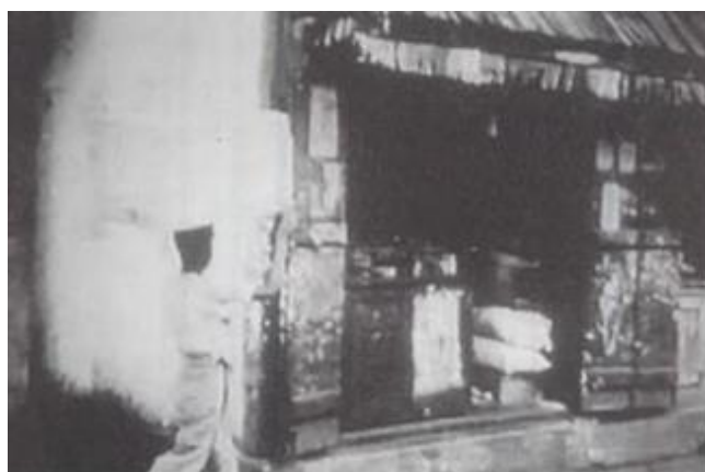
Fiona Tan, Facing Forward , video projection, 1999 Courtesy the artist, Frith Street Gallery, London

L'intention du montage est rendue encore plus évidente par le fait que dans la vidéo, certaines reprises, extraites d'archives, sont insérées et montrent les rues animées d'une ville d'Asie, où chacun vaque à ses occupations et personne ne semble se préoccuper de la caméra. Les objets de la fascination voyeuristique du reportage scientifique sortent donc du rôle d'"exemplaires" pour devenir des sujets, tandis que la caméra enregistre, sans imposer de pose, la routine quotidienne de piétons et de cyclistes.