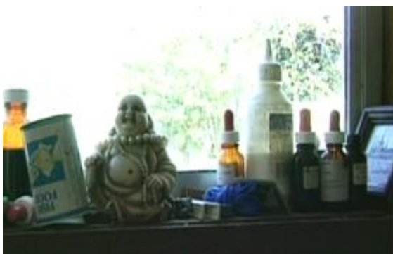
Fiona Tan, May you Live in Interesting Times , documentary film, 1997

En recomposant la géographie culturelle de cette mémoire parfois tourmentée, Fiona Tan met et enlève constamment ses habits de touriste, d'anthropologue et de migrante, guidée par le besoin d'établir un lien entre un passé qui persiste "dans le sang" ou dans la mémoire et la réalité, dans laquelle les liens des affections rétablissent la continuité émotive qui s'est perdue dans la dislocation. Il en ressort un portrait complexe, construit sur le voyage ininterrompu, sur l'écart entre observer et être observée, sur le rapport entre nécessité de représenter et se représenter.