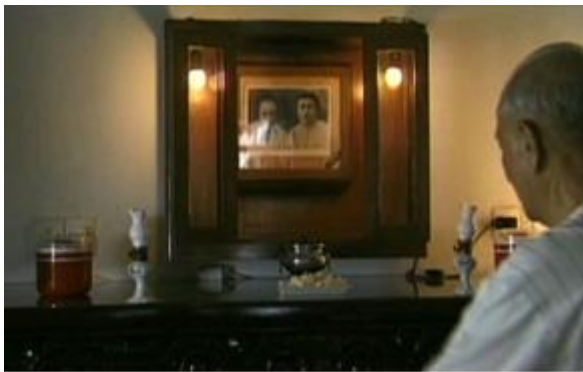
Fiona Tan, May you Live in Interesting Times , documentary film, 1997

A travers la voix des protagonistes, affleurent des circonstances qui dessinent des parcours d'existence disparates et loin de l'expérience de l'artiste, qui construit ces extraordinaires archives de vie en les intercalant avec son journal d'impressions, d'émotions, de notes, d'énigmes non résolues.