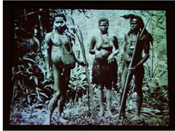
Fiona Tan, Facing Forward , video projection, 1999

Dans la vidéo de Fiona Tan, le montage souligne le caractère représentatif de ces diversités. Les sujets filmés, véritables “inventions visuelles”, n’ont pas en effet de présences réelles, mais se situent dans le monde des généralisations de type heuristique et taxonomique: les portraits d’Indonésiens, d’Africains et de Guinéens se suivent dans une progression apparemment confuse qui souligne la “logique discontinue” 3 du relativisme culturel et de ce que James Clifford nomme “collection de cultures” (2000: 249 et suiv.).