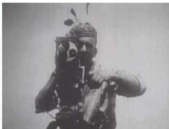
Fiona Tan, Facing Forward , video projection, 1999