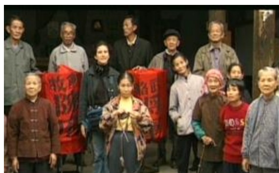
Fiona Tan, May you Live in Interesting Times , documentary film, 1997