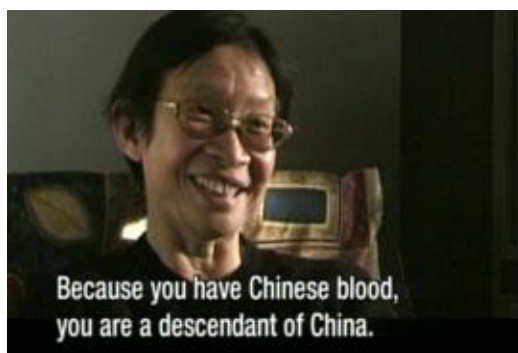
Fiona Tan, May you Live in Interesting Times , documentary film, 1997

Cette sorte d'épithète pourrait être utilisée pour commenter le dernier photogramme de May you live in interesting times , que Fiona Tan conclut avec la "photographie de famille", prise dans un village rural de la Chine contemporaine, où l'on peut voir l'artiste au sein d'un groupe de lointains parents jamais vus auparavant, qui ont le même nom qu'elle, mais au milieu desquels elle apparaît irrémédiablement "étrangère".