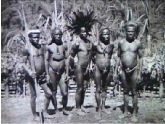
Fiona Tan, Facing Forward , video projection, 1999