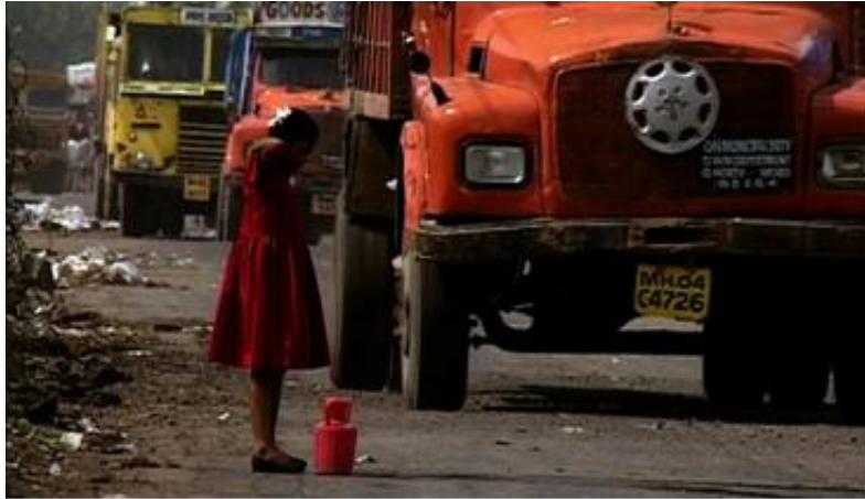
Fiona Tan, Disorient, HD video Installation, 2009 Courtesy the artist, Frith Street Gallery, London and Wako Works of Art, Tokyo.

Fiona Tan utilise le personnage de Marco Polo et crée, dans le contraste sémantique entre les deux vidéos, une espèce de “pont” entre les différentes époques historiques. Elle surmonte, de cette façon, les difficultés théoriques que Robert Young, dans Disorienting Orientalism (1990), avait constatées dans le discours d’Edward Said (1978). En effet, en explorant les potentialités de la vidéo et du récit, Fiona Tan met le spectateur dans la condition de “se dés-orienter” et de “se dés-orienter”, c’est-à-dire de confronter des savoirs contradictoires sur l’exotique qui discréditent le stéréotype discursif de l’Orient exotérique, immuable, fort de religiosité mystique et grouillant de marchés. Cette installation permet donc à Fiona Tan de faire une réflexion sur l’enchaînement des images, en créant une opposition entre enchantement et désenchantement. Celle-ci s’articule dans le dévoilement de ces mécanismes obsessifs qui caractérisent le voyage dans l’exotique vu comme “territoire du désir”. Il s’agit d’une méthode déjà expérimentée par l’artiste dans plusieurs de ses œuvres précédentes, parmi lesquelles certaines centrées sur l’analyse des rhétoriques modernistes de construction de l’altérité.