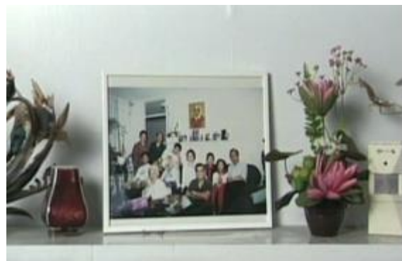
Fiona Tan, May you Live in Interesting Times , documentary film, 1997 Courtesy the artist, Frith Street Gallery, London