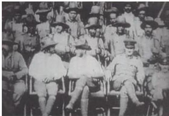
Fiona Tan, Facing Forward , video projection, 1999

Un tel mécanisme fonctionne dans Facing Forward (1999), où le mixage sur un échantillonnage d'images d'archives est encore plus explicite. Une fois de plus, Fiona Tan place le spectateur devant des séquences extraites des documentaires coloniaux récupérés dans les archives du Filmmuseum d'Amsterdam, pour accomplir une recherche sur les conditions de la perception et de la connaissance.