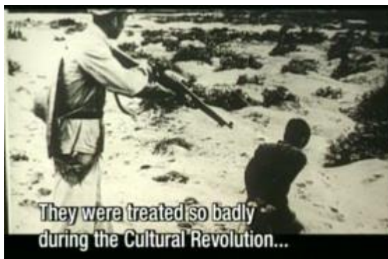
Fiona Tan, May you Live in Interesting Times , documentary film, 1997

Parcouru par une délicate tendance mélancolique, le film décrit des traces superposées de styles de vie, d'ambiances et de personnes qui assument la "posture du souvenir". 10 Les protagonistes se confrontent avec l'histoire de la colonisation hollandaise de l'Indonésie, les images des persécutions commises contre les Chinois pendant la dictature de Suharto, l'évocation des événements liés à la Grande Révolution culturelle promue par Mao, ainsi que les mémoires de détention et de migration qui s'alternent à des scènes familiales insouciantes et joyeuses.